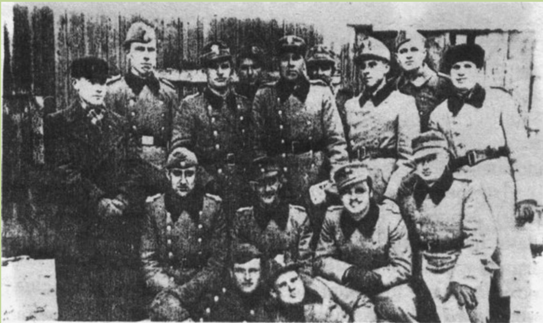
Старшини 102-го, 115-го і 118-го батальйонів на військових курсах в Мінську в 1942 р.