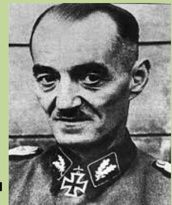
Григорий Васюра: каратель и ветеран войны